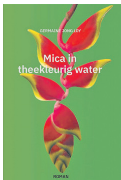
'Mica in theekleurig water' is de debuutroman van Germaine Jong Loy, geboren in Suriname en woonachtig op Curaçao.