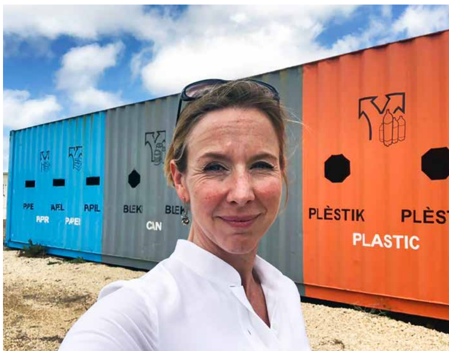
Staatssecretaris Stientje van Veldhoven tijdens haar bezoek aan een milieustraat op Bonaire.