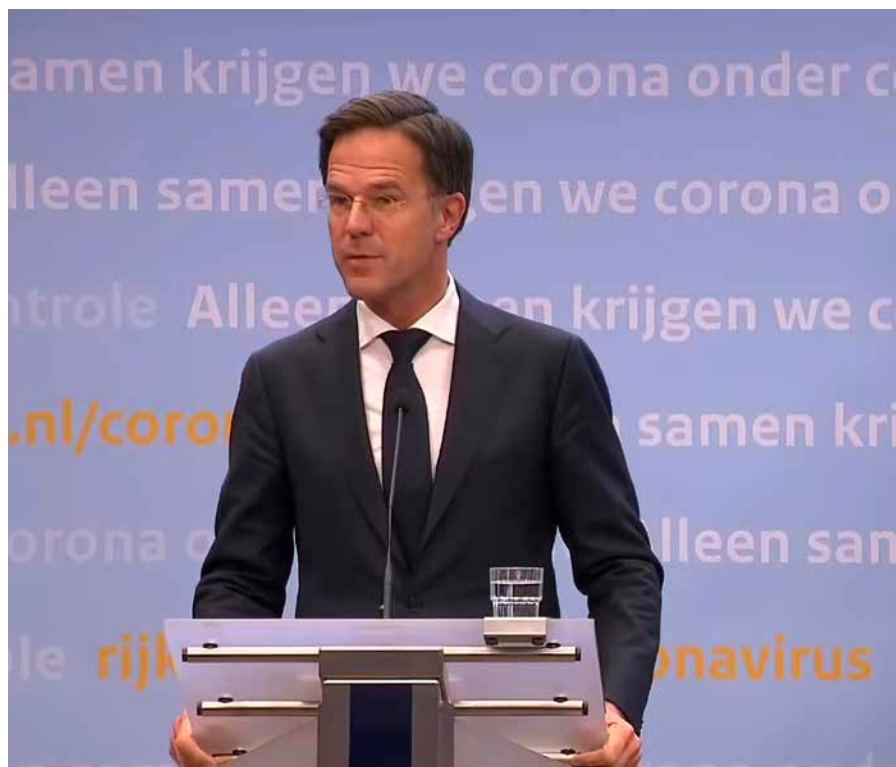
Premier Rutte kondigde op 3 november aan dat reizen naar Bonaire mag.

Bonaire had het virus al snel weer onder controle dus verzocht gezaghebber Rijna het ministerie van Buitenlandse Zaken medio oktober om code oranje in te trekken. „Maar toen kwam het OMT-advies naar buiten om alle buitenlandse reizen te ontraden. Wij vreesden het ergste. Dat minister-president Rutte bekendmaakte dat er wel mag worden gereisd naar de Caribische delen van het Koninkrijk die code geel hebben was een enorme opluchting. De hotels zagen onmiddellijk de boekingen weer op gang