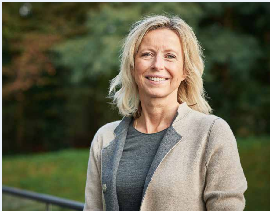
Minister Kajsa Ollongren (BZK): „Ik zou graag het Papiaments als taal willen beschermen en bevorderen.”

De minister toonde zich niettemin bereid uit te zoeken wat wel kan. „Ik zou graag het Papiaments als taal willen beschermen en bevorderen. We moeten kijken hoe we dat het beste kunnen doen. Misschien kan het in de vorm van een convenant of iets dergelijks. Daar ben ik mee bezig. Er lopen al gesprekken met het openbaar lichaam Bonaire en betrokken taalorganisaties.”