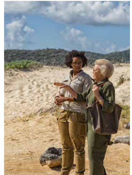
Prinses Beatrix tijdens haar bezoek in 2018 aan Bonaire.

financiële hulppakketten ook aandacht wordt besteed aan de continuïteit van het beheer van beschermde gebieden op de eilanden. Bescherming, beheer en behoud van de vitale natuurlijke hulpbronnen zullen van cruciaal belang zijn voor het herstel van beschadigde economieën na de Covid-19-pandemie.”