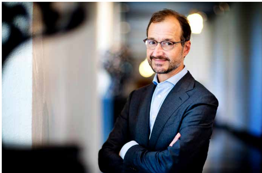
Minister Eric Wiebes (EZK) gaat in de olie.