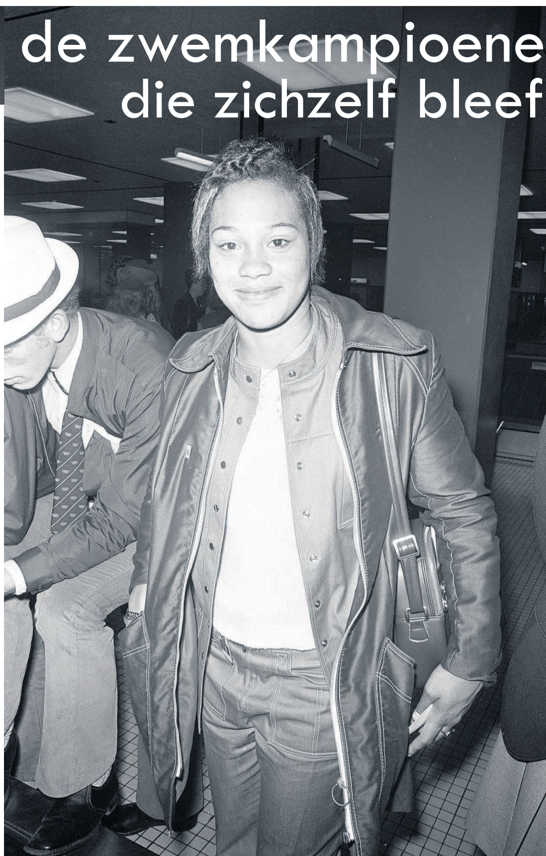
Teruggekeerd van de Olympische Spelen van 1972 in München.