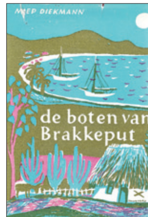
Omslagen van drie van Diekmanns Antilliaanse jeugd- en kinderboeken.

Miep had decennialang doelbewust aan image building gewerkt en beschermde het opgebouwde beeld als een waakhond. Een biografie wil voorbij dat imago kijken. Dat deden we ook, maar dat bleek een uitputtingsslag. Enkele van die heikle ervaringen hadden we naar buiten gebracht. Het was genoeg voor haar en zodoende ook voor mij. Haar archiefmateriaal - zeven volle dozen - ging naar het Literatuurmuseum, Den Haag. Daar ligt het te wachten om over enkele (?) jaren te worden doorgenomen zodat er alsnog een biografie geschreven kan worden.